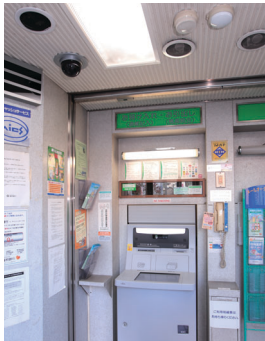
ATMには2種類のカメラを設置 (武生支店)

カメラは1280×960ピクセルの高解像度映像で、お客様の顔はもちろん、伝票などのやりとりも確認でき、監視目的に加えて、万一、業務上のトラブルが発生した際の検証・解決にも有効です。