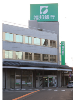
福邦銀行様 武生支店

株式会社 福邦銀行様は本店および各支店に、i-pro (アイプロ) シリーズによるネットワーク監視カメラシステムを導入されました。デジタルならではの鮮明な映像で、行内の安心・安全を見守る防犯目的はもちろん、業務支援システムとしても活躍。万一何らかの問題が発生した際の、その解決の効率化や時間短縮、およびお客様サービスの向上に貢献しています。