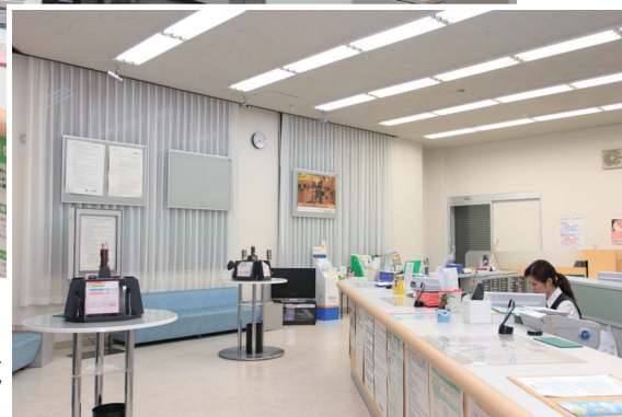
金庫や行員出入口など、カウンター内を見守るのはDG-NP244V(武生支店)