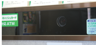
顔撮影用のDG-NP244Vはパネル越しに設置