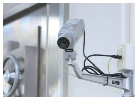
メガピクセルネットワークカメラ (武生支店)

カウンター撮影用にメガピクセルネットワークカメラDG-NP304V（またはDG-NP1000）、行員出入口や金庫およびATMの顔撮影用にネットワークカメラDG-NP244V、ATMの手元撮影用にネットワークカラードームカメラDG-NF282を、それぞれ設置。用途に応じた機種選定で、行内の重要なモニタリングポイントを死角なく撮影できるシステムを実現しています。中でもメガピクセルネットワーク