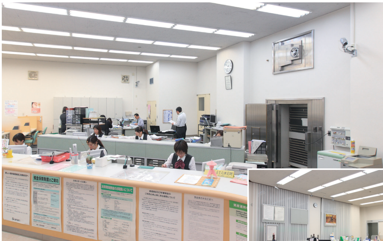
メガピクセルネットワークカメラがカウンター業務を見守る(武生支店)